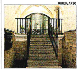
Entrada de cal Matricules

► UN TREBALL HISTÒRIC SITUA ELS PRIMERS PROPIETARIS CONEGUTS, LA FAMÍLIA ROIG, I TOTA L'EVOLUCIÓ DE LA CASA FINS ARA 8i9