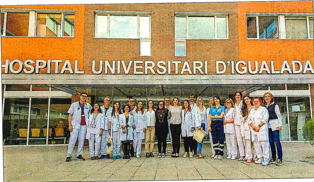
Els residents i l'equip docent del Consorci Sanitari de l'Anoia